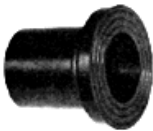
Втулка под фланец короткая